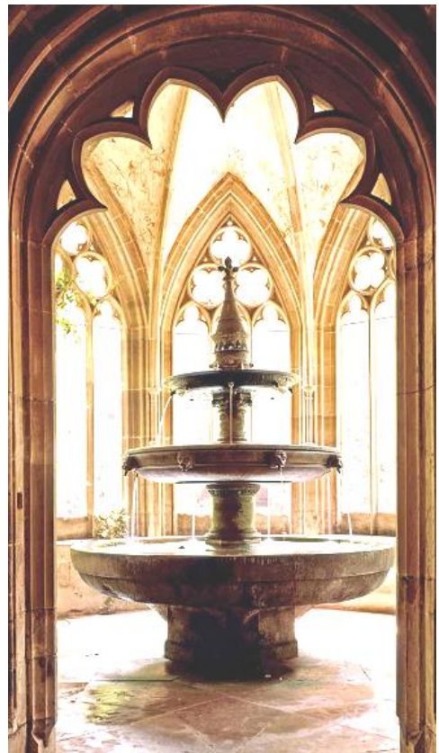
Brunnenhaus, Kloster Maulbronn

Bernhard von Clairvaux; zitiert nach „Der andere Advent“ (2012/13)