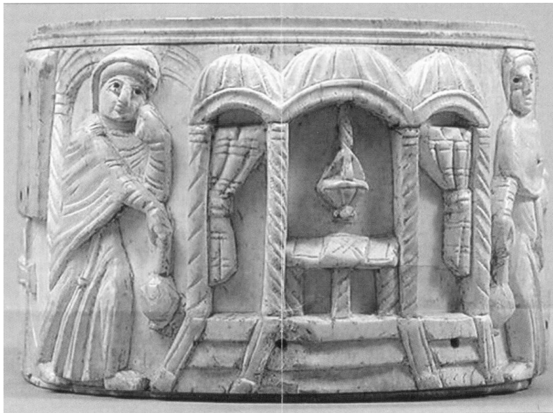
Salbentragende Frauen am Grab, 6. Jh.

Aller Augenschein sagt ein Grab ist ein Grab tot ist tot aus ist aus fertig nichts weiter